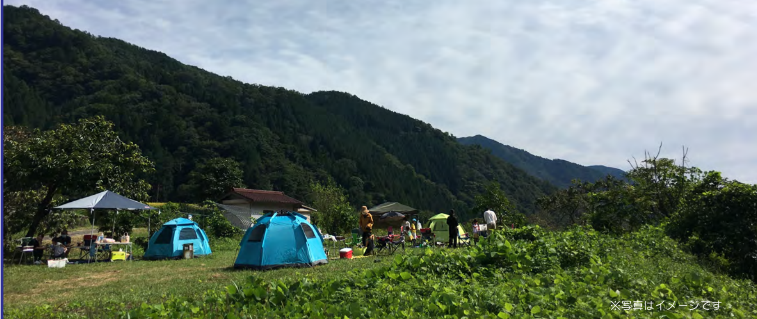
※写真はイメージです